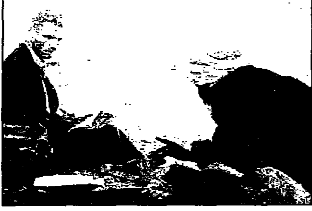
مشهد من فيلم «البريطانيون»

منذ الاهتمام من تصوير فيلم «البريطانيون» والمثلة الانكليزية كريستين سكوت توماس تفصل